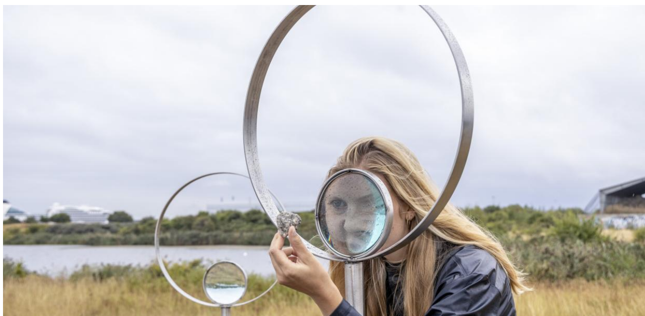
Opstillede forstørrelsesglas for enden af Nordhavn, hvor lokale og besøgende kan tage et nærmere kig på mikronaturen.